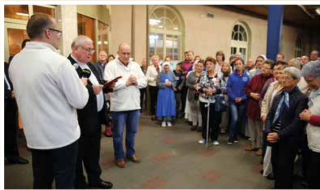
Požehnanie pútnikov a vlaku na stanici v Bratislave.