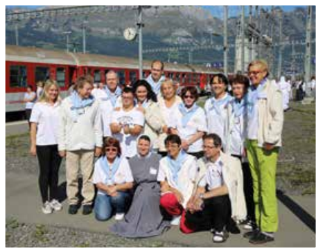
Lekárom a zdravotníkom...