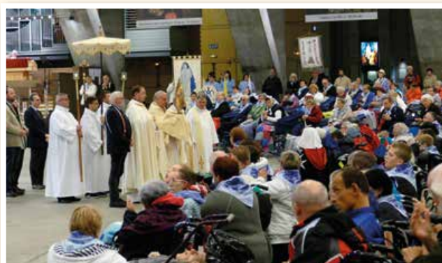
Eucharistické požehnanie našich pútnikov.