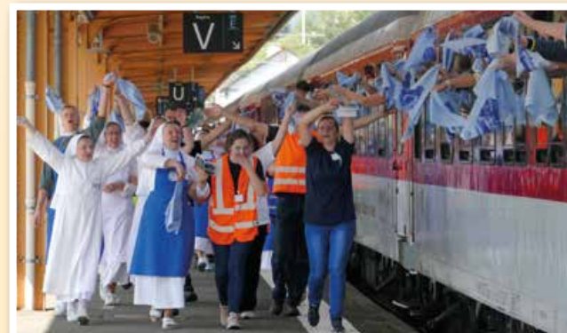
Rozlúčka s Lurdami na vlakovej stanici.