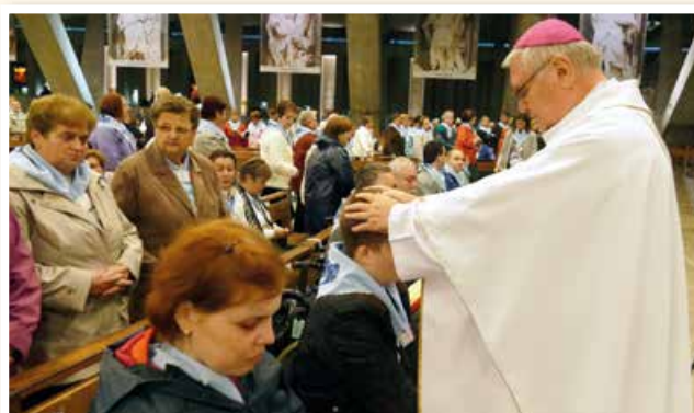
Udelenie sviatosti pomazania chorých.