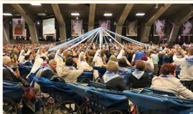
Medzinárodná sv. omša.