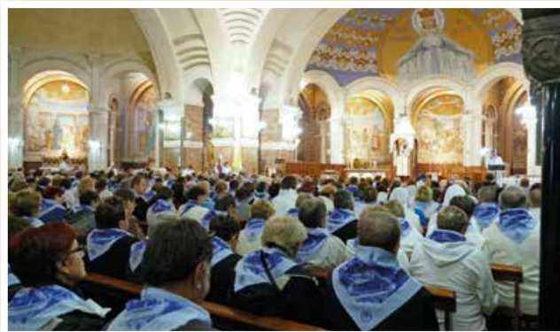
Úvodná sv. omša v Lurdoch.