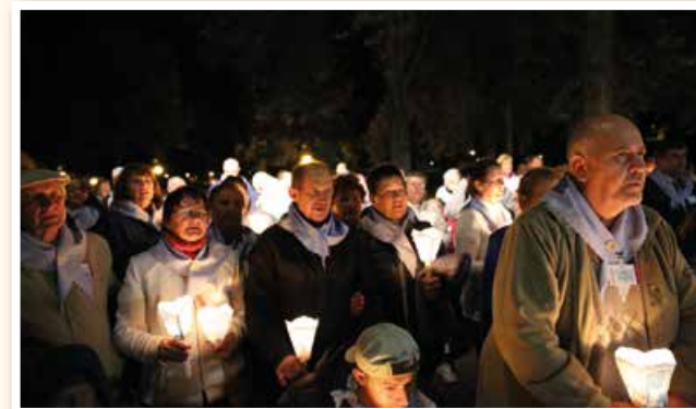
Mariánska procesia na čele so slovenskými pútnikmi.