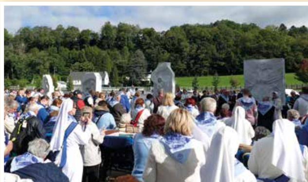
Križová cesta slovenských chorých.